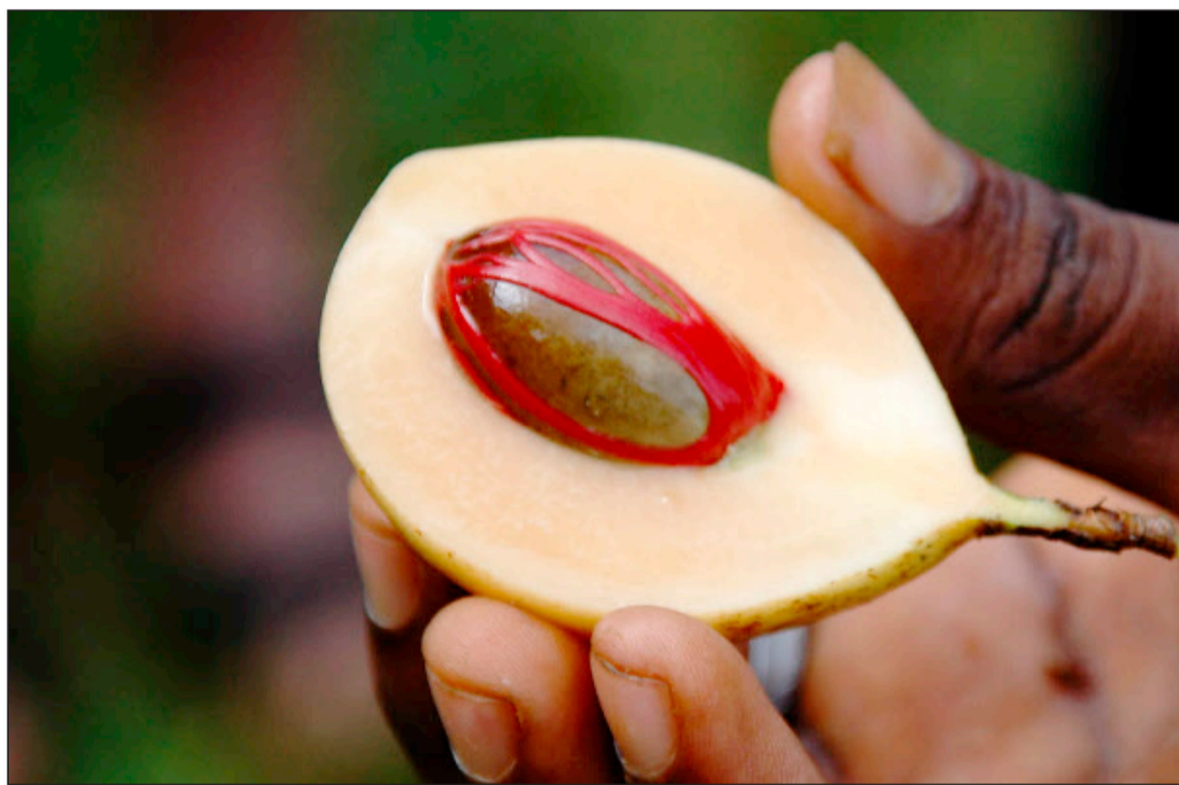
Als anregend gilt, was in Form, Geruch und Farbe eindeutig an Zweideutiges denken lässt.

Der Valentinstag ist heuer ein grosser Anreisetag, da er auf einen Samstag fällt. Für die Grächner Gastgeber steht es ausser Frage, dass dieser Tag zu einem besonderen wird: Das Vogel-Maskottchen Sisu begrüsst alle Gäste mit einer roten Rose. Grächen ermuntert die Anreisenden, den Tag der Verliebten mit einem romantischen Abend zu zweit zu feiern. Auf Wunsch betreuen erfahrene Pädagoginnen und Mütter die Kinder am Abend in der Ferienwohnung oder im Hotel des Gastes.