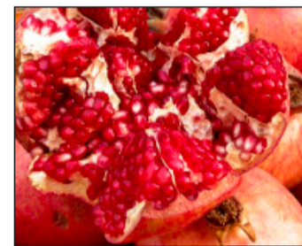
Auch Granatäpfel sollen aphrodisierend wirken.

Die Grundregeln einer kulinarischen Verführung sind denkbar simpel. Der Wahl der Speisen gehört höchste Aufmerksamkeit. Schon Casanova wusste, dass eine als Vorspiel gedachte Mahlzeit nie-