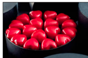
Zuckersüsse Herzen für den Valentinstag.

Aphrodisiaka werden seit Jahrtausenden verwendet. Und manches Zaubermittel fand in der Küche heimliche Anwendung. Man weiss von zahllosen Kräutlein und Ingredienzien, die im Dienste der Lustbarkeit auf den Teller gebracht werden. Bodenständiges wie Liebstöckel, Sellerie und Spargel zählen hierbei ebenso zu den Stimulanzien wie Ingwer, Muskatnuss und Safran als exotische Komparten. Kaum einer dieser kulinarischen Geheimwaffen ist indes eine wissenschaftlich haltbare Wirkung nachzuweisen. Doch weil der Glaube noch immer Berge versetzt, bleibt die Küche auch heute